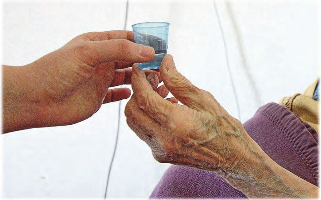
Eine Patientin bekommt ein tödliches Medikament überreicht