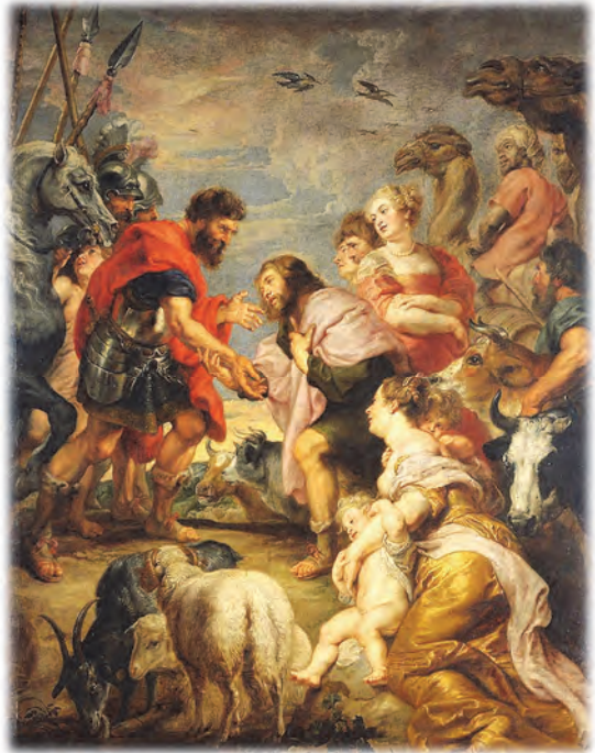
Jakobs Aussöhnung mit Esau Peter Paul Rubens (1577–1640)

wird er selbst von Laban betrogen: dieser legt ihm in der Hochzeitsnacht seine ältere Tochter Lea ins Zelt. Die geliebte Rahel bekommt Jakob zwar auch noch, muss aber jetzt zwei Mal 7 Jahre für seinen Onkel arbeiten. Während dieser Zeit wird Jakob reich und die Familie wächst. Nach 20 Jahren merkt er, dass sein Onkel ihm nicht mehr sehr zugetan war und macht sich im Auftrag Gottes auf den Heimweg in das Land, das Gott ihm in jener Fluchtnacht versprochen hatte. Eine abenteuerliche Reise, auf der Jakob