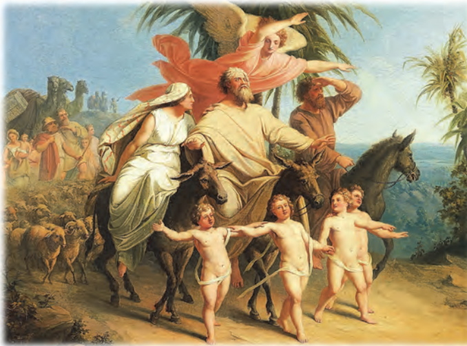
Abraham erblickt das verheißene Land © Anonym nach Schnorr von Carolsfeld

75 Jahre alt war Abraham, als er mit Sara, seiner Frau und seinem Neffen Lot, Knechten, Mägden und seinem gesamten Viehbesitz nach Süden in Richtung Kanaan aufbrach. So erzählt uns das Alte Testament im ersten Buch Mose Kapitel 12. Gottes Stimme hatte Abraham gehört, die ihn aufgefordert hatte sein Land und seine Sippe zu verlassen und wegzuziehen in ein Land, das er, Gott, ihm zeigen werde.